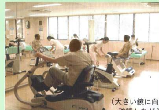
▲実際のリハビリ風景

40坪のゆったりとした空間です。親切丁寧を心がけ、専従の理学療法士が痛みをやわらげるリハビリテーションを行います。